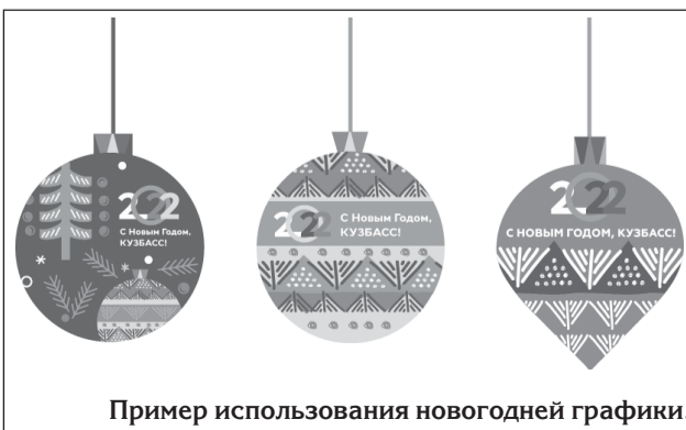
Пример использования новогодней графики.