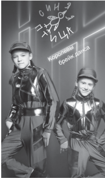
демонстрируют столь высокий уровень мастерства.

В новом сезоне к жюри – ректору Академии русского балета Николаю Цискаридзе, пианисту Денису Мацуеву и народному артисту России Сергею Безрукову – присоединились народная артистка России Марина Неелова и молодой композитор Кирилл Рихтер. Актрису Марину Неелову выступления первых семи участников телешоу повергли в шок. Для нее стало полной неожиданностью, что юные конкурсанты