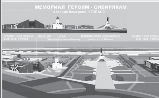
На фото: визуализация мемориала Героям-сибирякам, разработанная СДС.

12 гранитных пилонов расположат вдоль дорожки к памятнику Героям-сибирякам в Кемерове. Военно-исторический комплекс будет включать точную копию памятника «Воин-освободитель» в берлинском Трептов-парке, прототипом которого стал кузбассовец Николай Масалов. Комплекс поможет сохранить память кузбассовцев о Великой Отечественной войне и украсит город, а связанные с ним мероприятия укрепят патриотическое воспитание молодежи. Работы по его строительству планируется начать 15 февраля 2022 года и полностью завершить к осени того же года.