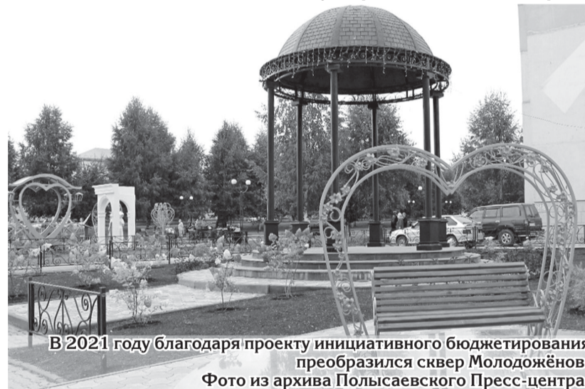
В 2021 году благодаря проекту инициативного бюджетирования преобразился сквер Молодожёнов.