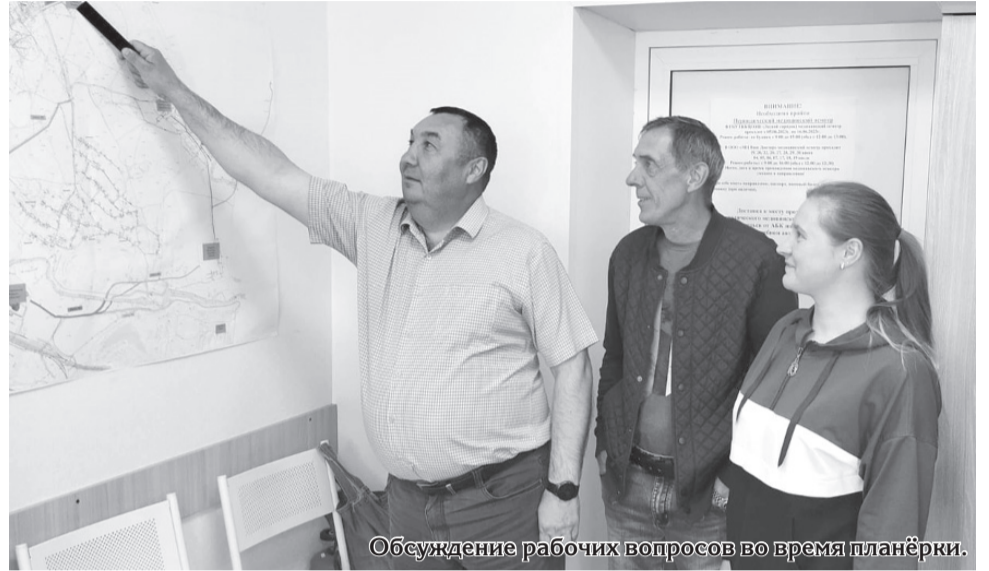
Обсуждение рабочих вопросов во время планёрки.

Потому и говорит мне стеснительно: «Да что всё обо мне? О них пишите». Под-