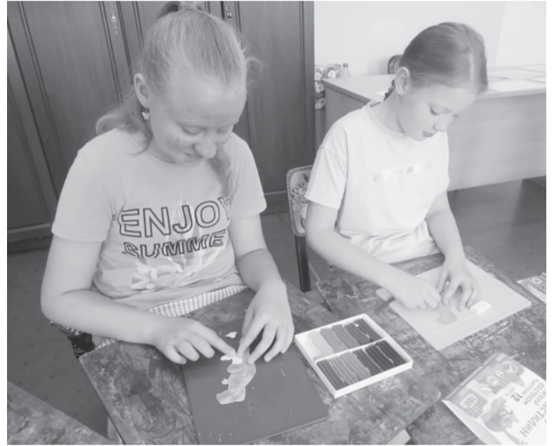
Мастер-класс «Пластилиновые динозавры».

Мария ВАНЮКОВА. Фото из аккаунта ДШИ №54 (социальная сеть ВКонтакте).