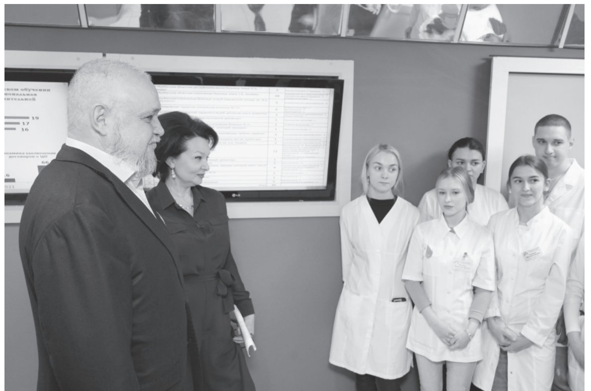
«Здоровый Кузбасс – наша цель, и команда региона с ней справится»