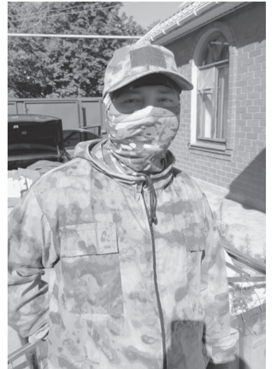
Сын встречает родных.

Утром должен был позвонить командир и договориться о времени и месте встречи, но в тот день по какой-то причине у него не получилось. Зато у матери было время