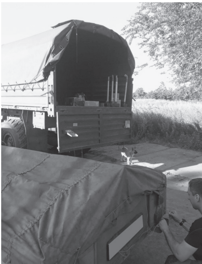
Передача гуманитарного груза.