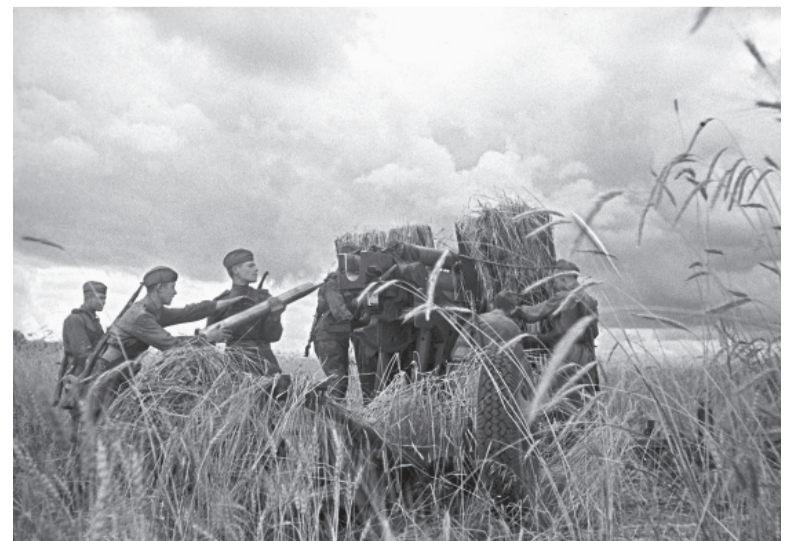
Зенитный расчёт во время боя.

Они остались живы, судьба их так наградила. Впереди была целая жизнь. «Вспоминать о