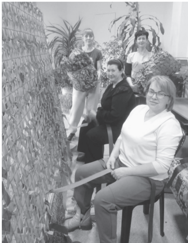
Полысаевские волонтеры плетут маскировочные сети.