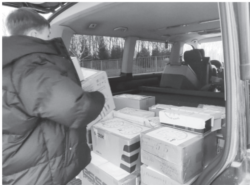
Ученики школы №44 отправляют посылки в зону проведения СВО.