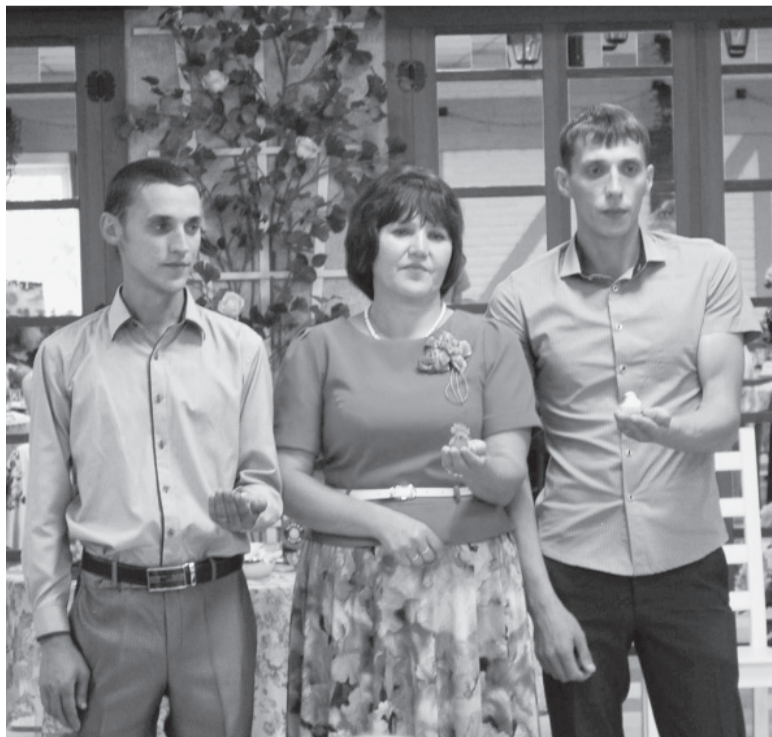
Сыновья - мамы поддержка и опора.

Надежда СУВОРОВА.