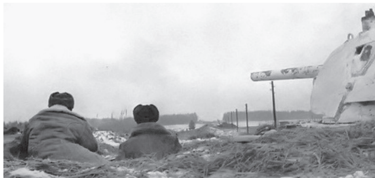
Танк Т-34 на дальних подступах к столице, в районе Волоколамского шоссе, Западный фронт, ноябрь 1941 года