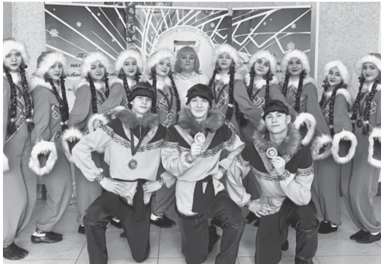
Хореографическая студия Ритм.

Подготовила Надежда СУВОРОВА. (Информация и фото отдела культуры и ДК «Родина»).