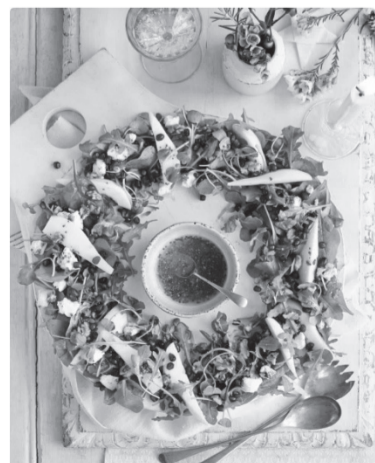
В форме новогоднего венка можно оформить любой салат.

На три порции необходимо взять 300 г мякоти говядины, 300 г свежих огурцов, 1 луковицу, 1 красный болгарский перец, 2 зубчика чеснока, 4 ст. л. соевого соуса, 1 ст. л. растительного масла, 2 ст. л. яблочного уксуса, по 0,5 ч. л. красного жгучего перца,